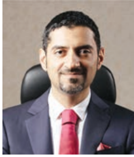
○ وزير شؤون الكهرباء.

والشعوب في ظل المسيرة التنموية الشاملة بقيادة حضرة صاحب الجلالة الملك المظدي، ويأتي هذا التكريم في ظل استراتيجية واضحة العطاء بقيادة سموها للمجلس الأعلى للمرأة ونتاج هذا العمل ترسيخا لمكانة المرأة البحرينية في جميع المجالات.