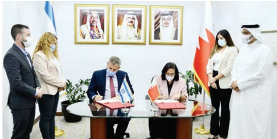
○ وزيرة الصحة توقع اتفاقية التعاون المشترك.

المملكة، مشيرة إلى أنه سيتم تقديم الدعم المتبادل بما يخدم المصالح المشتركة، وتعزيز فرص التعاون بين الجانبين. وقد أشاد الوفد خلال اللقاء بحفاوة الاستقبال وكرم الضيافة، وبماتنة وتطور النظام الصحي في مملكة البحرين، وبمستوى كفاءة الطواقم الصحية الوطنية المؤهلة والتي تعمل بجد واجتهاد طبقاً للمعايير الدولية المعتمدة. وفي ختام اللقاء أعربت وزيرة الصحة عن شكرها وتقديرها للتعاون والتنسيق المشترك المتواصل لتحقيق تطلعات التعاون بين الجانبين في المجال الصحي، علماً بأن برنامج الوفد يتضمن زيارات مختلفة لمرافق صحية مثل مستشفى الملك حمد الجامعي ومجمع السلمانية الطبي ومركز الشيخ عبدالله بن خالد آل خليفة الصحي، إضافة إلى زيارة للمجلس الأعلى للصحة.