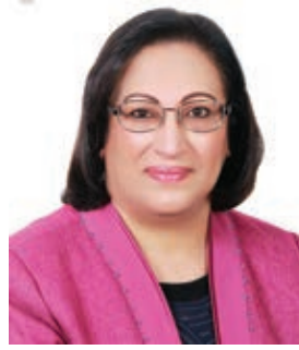
○ وزيرة الصحة.

والشعوب في ظل المسيرة التنموية الشاملة بقيادة حضرة صاحب الجلالة الملك المظدي، ويأتي هذا التكريم في ظل استراتيجية واضحة العطاء بقيادة سموها للمجلس الأعلى للمرأة ونتاج هذا العمل ترسيخا لمكانة المرأة البحرينية في جميع المجالات.